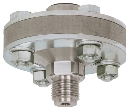
Мембранные разделители с резьбовым присоединением, модель 990.10

„Применение, принцип действия, конструкции“.